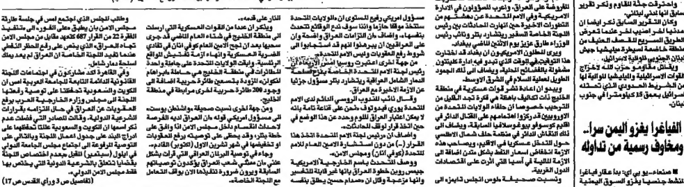
الأمم المتحدة تدين العراق لانتهاكها اتفاقية حظر أسلحة الدمار الجماعي

صدام يوقف التعاون مع المفتشين والوكالة الذرية امريكا تلوح بضربة عسكرية.. وروسيا تلوم بتلر